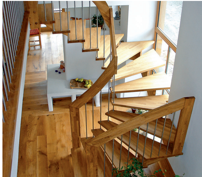
Geländer getragene Ausführungen